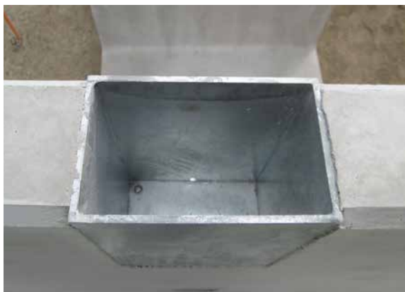
天端にボックスをセットし出荷致します。