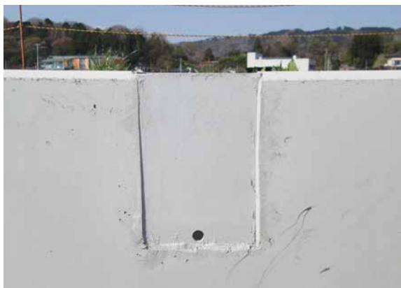
ボックス金属部に表面塗装もできます。