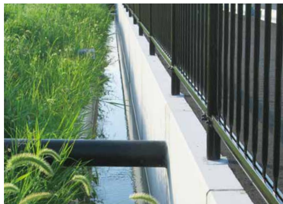
TFC(片高タイプ)に使用